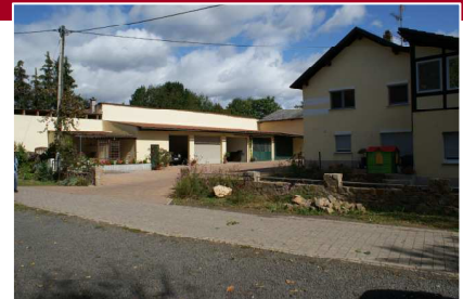
Gau-Heppenheim Leistung: 65 kW