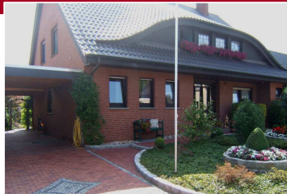
Wettringen Leistung: 30 kW