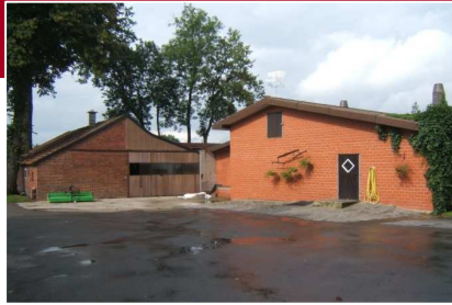
Freren Leistung: 110 kW