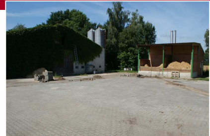
Papenburg Leistung: 2 x 150 kW