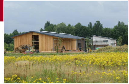
Senden Leistung: 50 kW