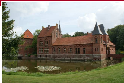
Legden Leistung: 110 kW