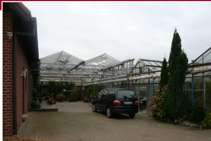
Neuenkirchen Leistung: 150 kW