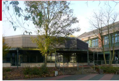
Fürstenberg Leistung: 300 kW