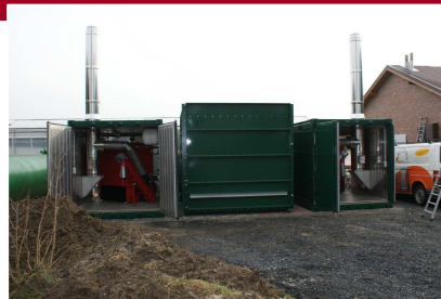
Offenstein Leistung: 300 kW